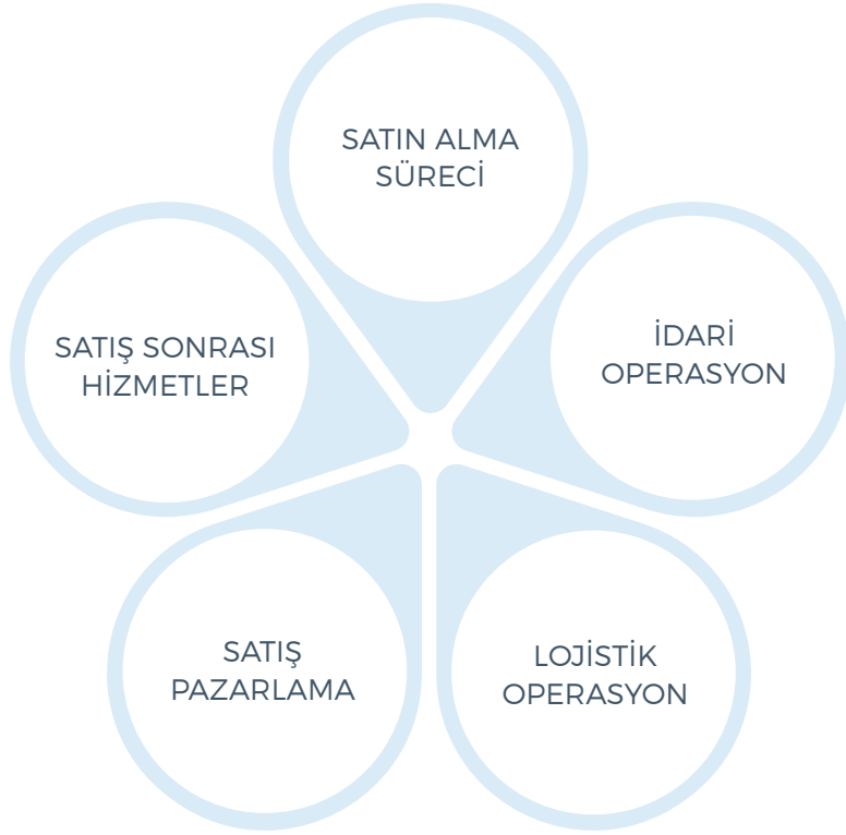
Doğuş Otomotiv Çevresel Etki-İş Yaşam Döngüsü

Şirketimizin iş yaşam döngüsü boyunca çevresel etkileri beş ana başlık altında toplanmıştır: